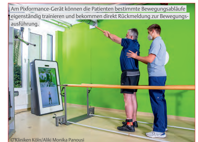
Am Pixformance-Gerät können die Patienten bestimmte Bewegungsabläufe eigenständig trainieren und bekommen direkt Rückmeldung zur Bewegungsausführung.

S. Gottschalk: Das ist individuell sehr verschieden. Im Idealfall wird der Patient nach Hause entlassen und dort durch den Pflegedienst, ambulante Therapie und Angehörige unterstützt. Wir kümmern uns darum, dass die Hilfsmittel wie Rollstuhl, Rollator oder Bauchbandagen rechtzeitig zur Verfügung stehen. Für Gelenke, die gestützt werden müssen, fertigen wir individuelle Gipsschienen an. Zur optimalen Hilfsmittelversorgung befinden wir uns im engen Austausch mit verschiedenen Sanitätshäusern. Unser Ziel ist es, dass unsere Patientinnen und Patienten auch nach der Reha bestmöglich für ihren Alltag gewappnet sind. Dafür stellen wir bereits während des Aufenthaltes bei uns die bestmöglichen Weichen. (cb)