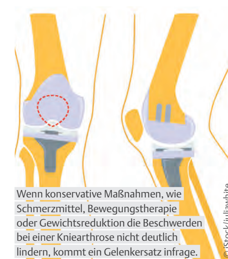
Wenn konservative Maßnahmen, wie Schmerzmittel, Bewegungstherapie oder Gewichtsreduktion die Beschwerden bei einer Kniearthrose nicht deutlich lindern, kommt ein Gelenkersatz infrage.