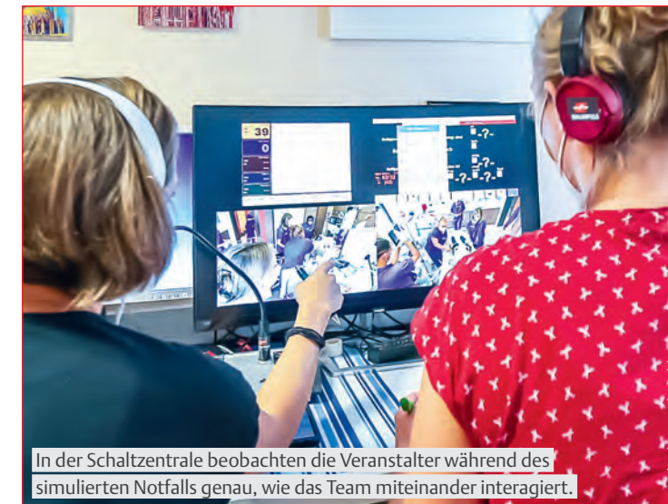
In der Schaltzentrale beobachten die Veranstalter während des simulierten Notfalls genau, wie das Team miteinander interagiert.

Ein großer Vorteil des Simulationstrainings ist, dass sich das Team in den eigenen Räumlichkeiten und nicht in einer fremden