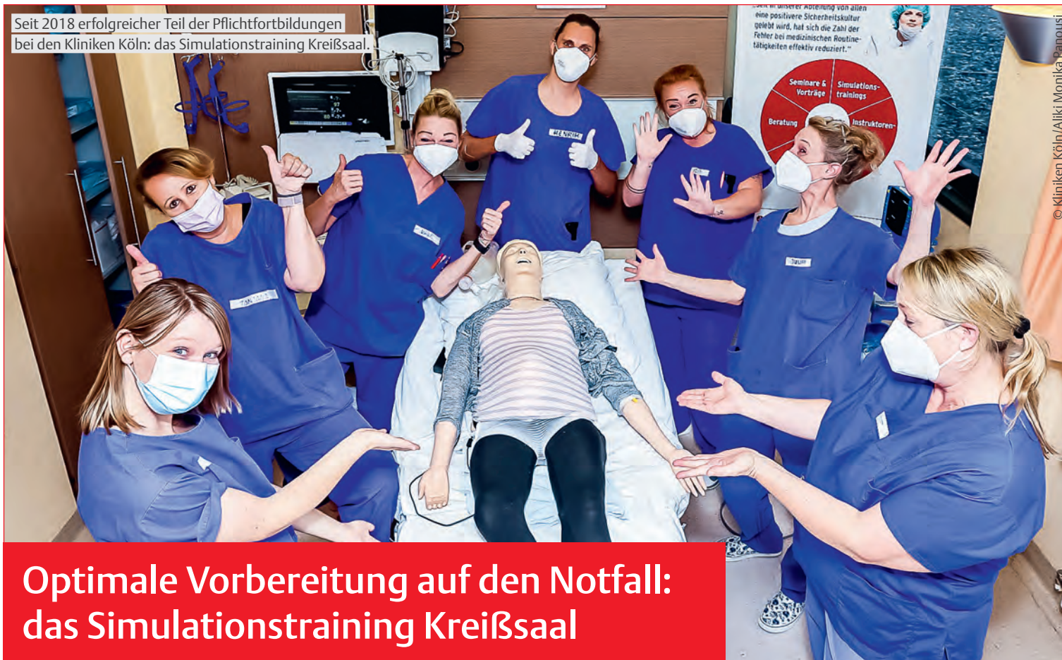
Seit 2018 erfolgreicher Teil der Pflichtfortbildungen bei den Kliniken Köln: das Simulationstraining Kreißsaal.