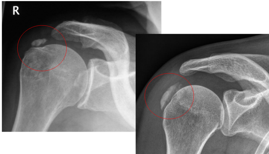
Abb. 1: Deutliche Kalkablagerungen im Sehnenansatz unter dem Schulterdach mit zwei verschiedenen Beispielen.